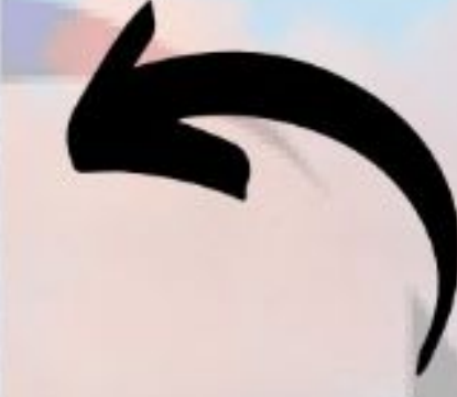
L-B sınıfı öğrencimiz Sümeyye TANRIVERDİ'nin resim çalışması

Sana olmaz dökülen kanlarımız sonra helâl,