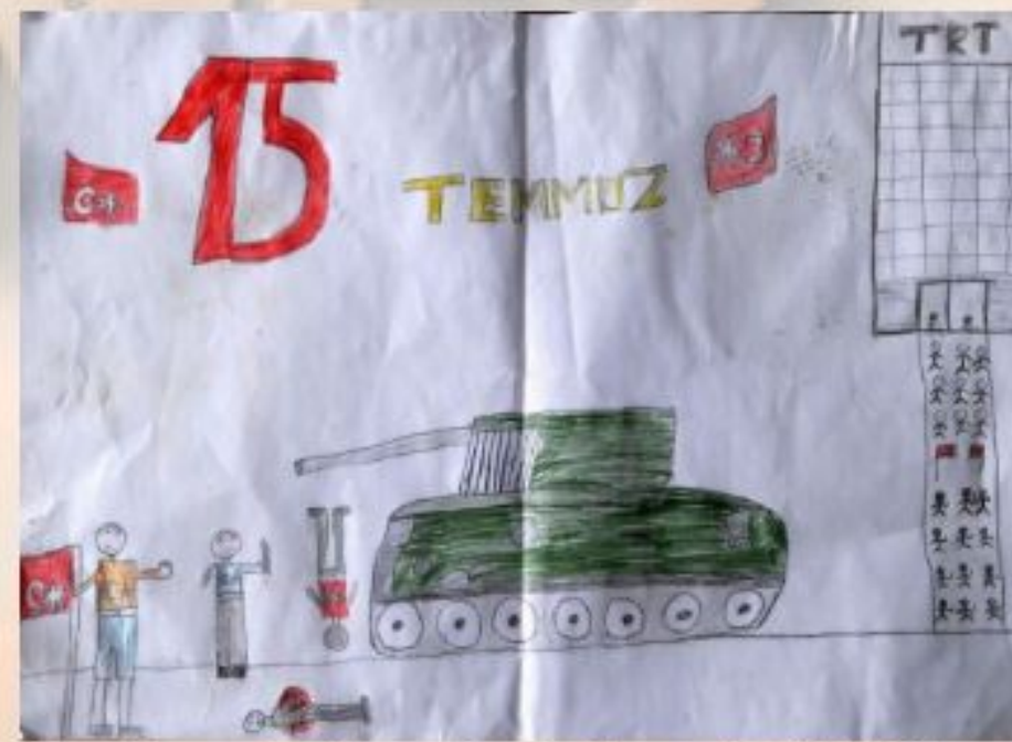
3-B sınıfı öğrencimiz Emre BAKIR'ın resim çalışması

Çatma, kurban olayım çehreni ey nazlı hilâl!